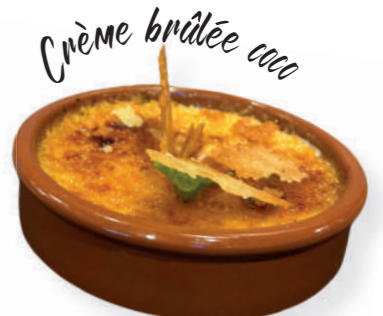
Crème brûlée coco