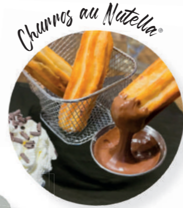
Churros au Nutella