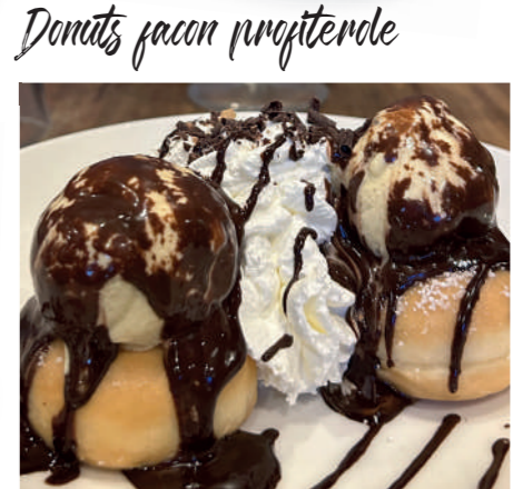
Donuts façon profiterole