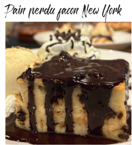
Pain perdu façon New York