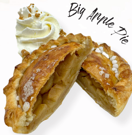
Big Apple Pie

Assortiment de 3 minis desserts + café ou thé