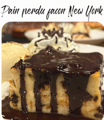
Pain perdu façon New York