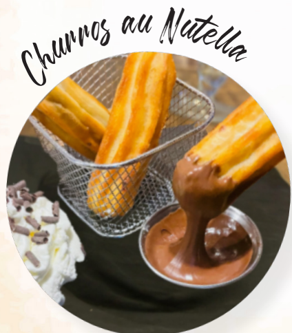
Churros au Nutella