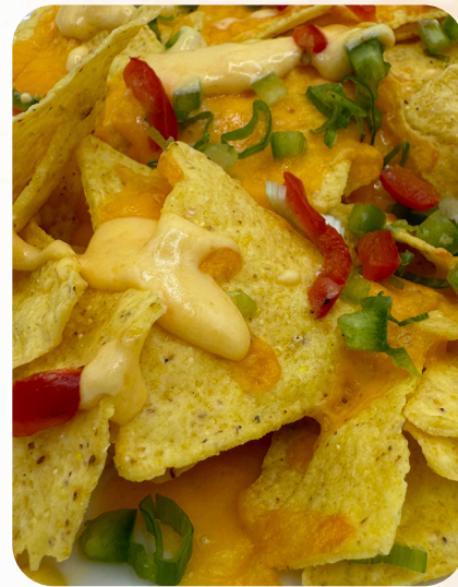
Nachos au cheddar fondu