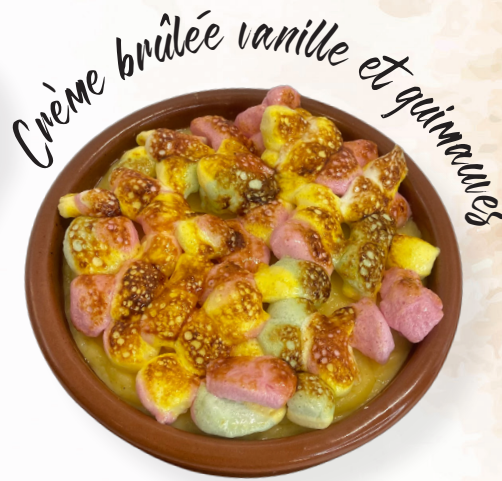
Crème brûlée vanille et guimauves